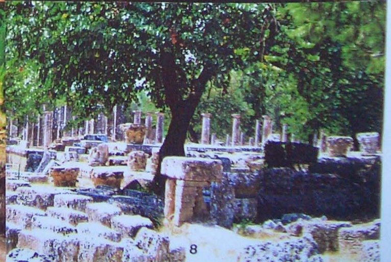
1 : NEMEA, 2 : 30 km, 3 : 50 km, 4 : 80 km, 5 : 105 km, 6 : 120 km, 7 : 150 km, 8 : OLYMPIE