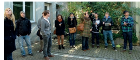
Studierende erkunden Feuchtwangen

der Fakultät AR konnten mit ihrer Arbeit „Kultur-Areal-Feuchtwangen“ gleich drei Preise abräumen: Sie erhielten einen Preis bei dem von der Stadt Feuchtwangen ausgelobten internen studentischen Wettbewerb, sie gewannen den Bürgerpreis bei der Eröffnung der Ausstellung in Feuchtwangen und eine Anerkennung im nationalen Studierendenwettbewerb der renommierten Fachzeitschrift „Baumeister“, bei dem die Konkurrenz beachtlich war.