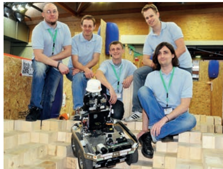
„AutonOHM“ mit Georg

Ende April nahm das Team „AutonOHM“ der Fakultäten efi und MB/VS zum zweiten Mal am „RoboCup German Open Wettbewerb“ in Magdeburg teil und schaffte es auf das Siegertreppchen. Mit einem hervorragenden zweiten Platz qualifizierte sich das Team AutonOHM der TH Nürnberg für die kommende „RoboCup Rescue Weltmeisterschaft“. Der mobile Roboter Georg wurde seit der ersten Teilnahme im Jahr 2012 hinsichtlich eingesetzter Sensorik, Datenverarbeitung und kinematischer Fähigkeiten verbessert. Als ferngesteuerte Multi-Sensorplattform macht sich Georg auf die Suche nach Lebenszeichen auf seinen Erkundungsmissionen. Dieses Projekt wird gefördert von der STAEDTLER Stiftung und der Initiative „Mehr Qualität in der Lehre“. ▶ Prof. Dr. S. May/Prof. Dr. M. Koch/E. Zapf