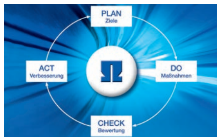
Der Qualitätsregelkreis der TH Nürnberg