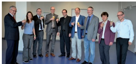
Ein Prost auf die innovativen Lehrprojekte

ausgeschrieben. Nach einem Auswahlverfahren werden nun acht Lehrprojekte mit insgesamt 600.000 Euro gefördert. Die Projekte kommen aus den Fakultäten AW, BI, BW, SW, VT, IN und aus der Hochschulleitung.