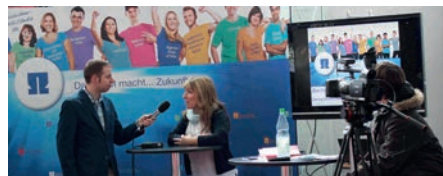
Interview bei der Hannover Messe

Energieeffizienz, Industrie 4.0 und Security in der Maschinensteuerung. Das waren die zentralen Themen, die Studierende des Studiengangs Technikjournalismus der Fakultät AW auf der diesjährigen Hannover Messe recherchierten. Darüber hinaus führten sie auch Interviews am Stand der TH Nürnberg in Halle 11. Dort standen Expertinnen und Experten von Firmen, Verbänden und Verlagen Rede und Antwort. Der Studiengang war bereits zum zweiten Mal mit einem Stand im Bereich TecToYou der Hannover Messe vertreten. Mit Unterstützung des Fachverbands Automation des ZVEI und der Organisatoren von TecToYou konnte die Recherche in Hannover möglich gemacht werden. ▶ Prof. V. Banholzer