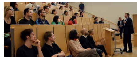
Gut besuchter Infomonat

Großen Zuspruch fand der neue „Infomonat April – BW Lunch Break“ der Fakultät BW . In der dreiteiligen Inforeihe zu den In-