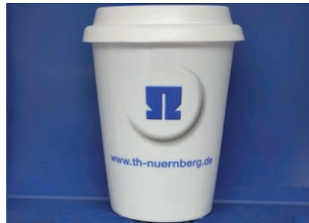
Der neue Coffee-to-Go-Becher

Wer gerne Kaffee, Tee oder andere Heißgetränke trinkt, kann dafür jetzt den neuen Coffee-to-Go Becher aus der „TH-Nürnberg-Kollektion“ nutzen. Der Becher aus Keramik hat einen Silikondeckel mit Trinköffnung und kostet im OHM-Shop 5,50 Euro. ▶ P. Schröder