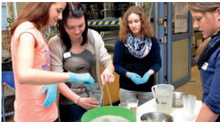
Spannende Einblicke: Der Girls'Day

Bereits zum achten Mal beteiligte sich die TH Nürnberg Ende April am bundesweiten Aktionstag Girls'Day. Auch heuer gab es für die Schülerinnen wieder viele spannende Einblicke in Naturwissenschaften und Technik in Studium und Beruf. Das Angebot des Hochschulservice für Gleichstellung war sehr begehrt und ganz schnell ausgebucht. ▶ B. Merz