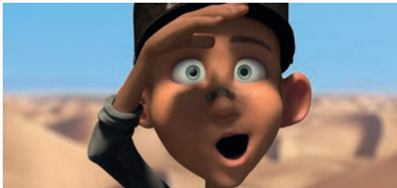
„About Simon“ lief bei der OHMrolle Foto: Fak. D

Die Fakultät D hatte im April gleich zwei kreative Highlights für das breite Publikum: Eine Ausstellung mit CGI-Bildern von Prof. Michael Jostmeier und seinen Studierenden. Und die beliebte OHMrolle, die ihr 25. Jubiläum feiern konnte. Bei der Ausstellung gab es Fotos zu sehen, die am Computer erstellt wurden und mögliche Einsatzbereiche eines Gyrokopters zeigten. Auch das Original-Fluggerät war vor Ort. Die beliebte OHMrolle war restlos ausverkauft und zeigte die neuesten Kurzfilme, Werbespots, Music Videos und Motion Graphics aus dem Studienfach „Film & Animation“. ▶ J. Stork/W. Feige